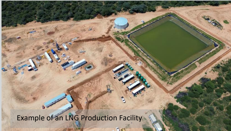
Example of an LNG Production Facility