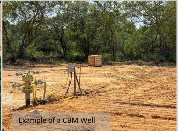
Example of a CBM Well